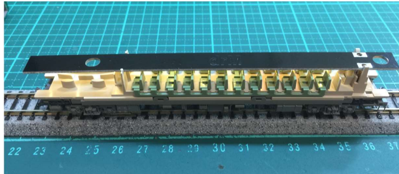
上圖為安裝示意圖